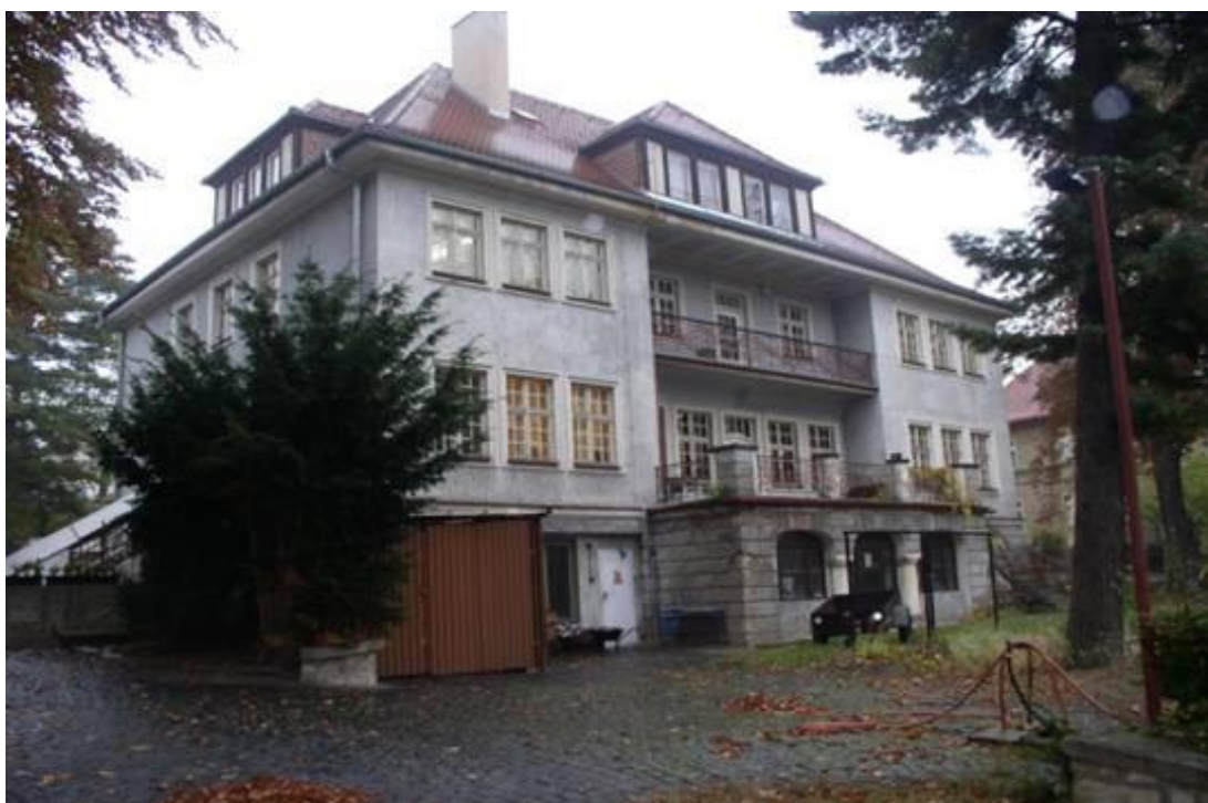
budova Praktické školy dvouleté